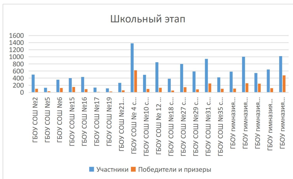
Диаграмма №1 Количество участников школьного этапа Всероссийской олимпиады школьников

Наибольшие показатели среди победителей и призеров в районном этапе ВсОШ (Таблица №12) наблюдаются по итальянскому языку (701%), технологии (58%), литературе (58%), экологии (51%) Наиболее низкие показатели среди победителей и призеров в районном этапе ВсОШ наблюдаются по истории (7%), праву (10%), математике (6,2%), русскому языку (5,2%), Искусству МХК (13,7%), обществознание (14%).