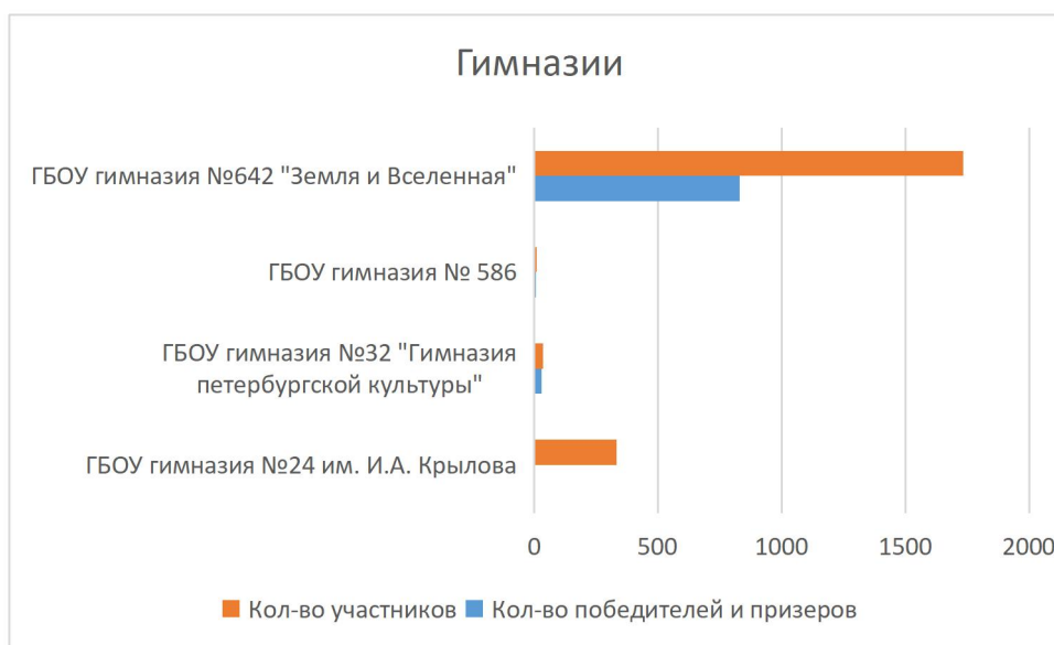
Диаграмма 3. Охват и результативность участия обучающихся гимназий Василеостровского района в мероприятиях (олимпиадах, конкурсах и т.п.) за исключением ВСО

Из диаграммы 3 видно, что среди гимназий Василеостровского района наибольшее количество участников в ГБОУ гимназия №642 "Земля и Вселенная" (1735/ 78,7%), наибольшую результативность показала ГБОУ гимназия №642 "Земля и Вселенная"(829/37,6%). Результаты ГБОУ гимназии №11 и ГБОУ гимназия № 586 невозможно сравнить, т.к. нет достоверных данных.