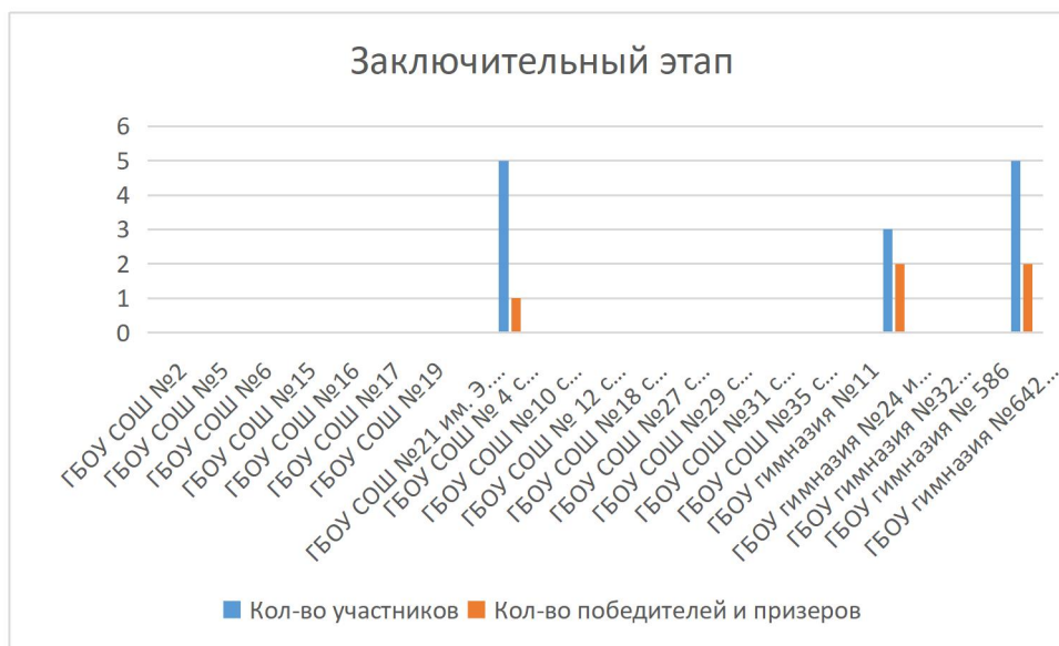
Диаграмма №4 Количество участников заключительного этапа Всероссийской олимпиаде школьников