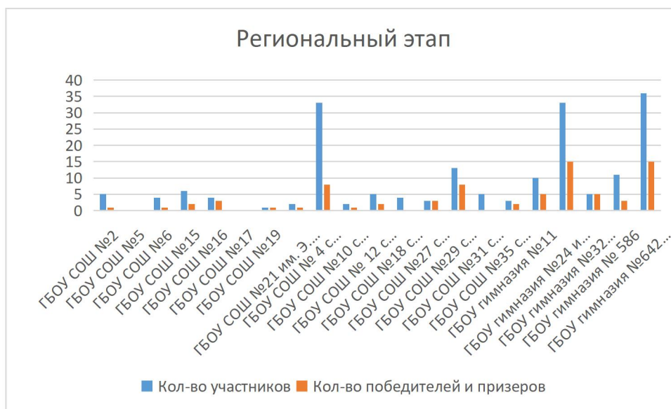
Диаграмма №4 Количество участников регионального этапа Всероссийской олимпиаде школьников